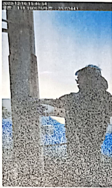
附图：临沂太合食品有限公司